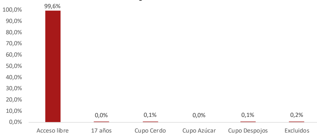
Gráfico 2 – Importaciones de Perú desde Canadá según categoría de desgravación, bajo un supuesto de aprovechamiento pleno de preferencias 16 15° año de vigencia del TLC Perú-Canadá

Nota: Acceso libre incluye categorías que cumplieron con su respectivo periodo de desgravación al 15° año de vigencia del TLC.